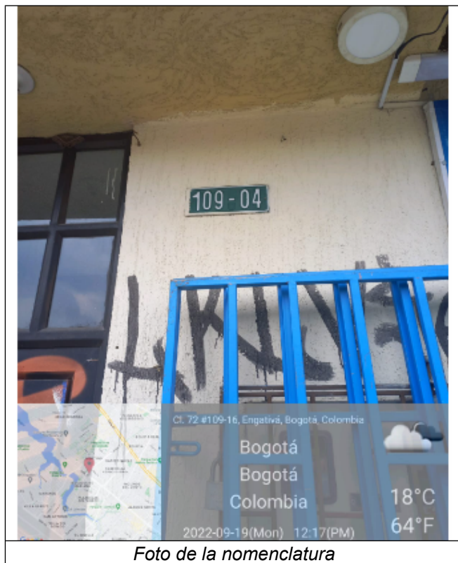
Foto de la nomenclatura